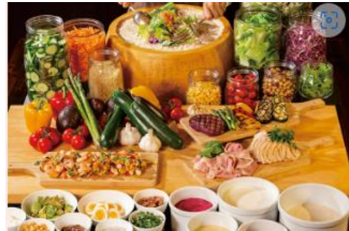
「ヒルトン東京ベイ HP より」